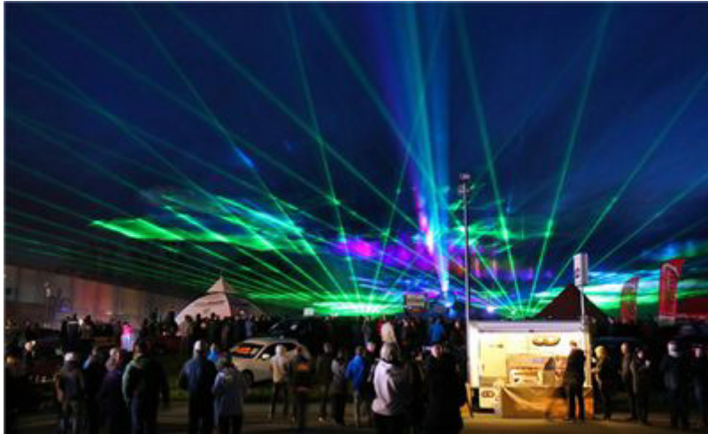
Eine faszinierende Lasershow gehörte zum Programm des Eröffnungsabends.