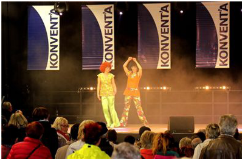
Ein Höhepunkt der Konventa 2016: Die Modenschau im Wandel der Zeiten mit dem „Fashion Magic Show Team“.